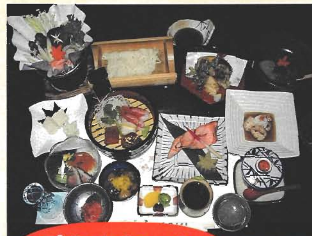
デラックスコース